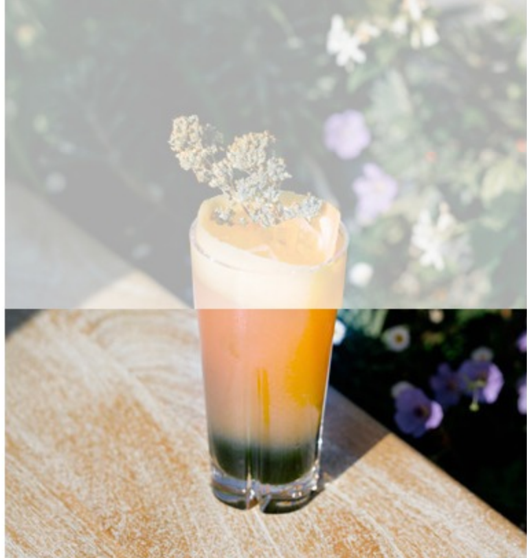
本日のカクテル「4ユーロ」

また北マレにも、ルーフトップが自慢の新しいホテルが誕生したばかり。ホテル・ナショナル・デ・ザール・ゼ・メティエは、3区に位置し、ボンピドーセンター近くもあり立地も抜群。開放的で広々としたルーフトップには、白を基調としたソファ席が並び、バーでカクテルをオーダーして、ゆっくり夏の夜を楽しむのにぴったりのアドレスだ。